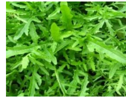
9 Wilde Rauke