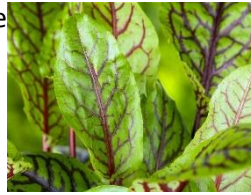
5 Rote Sauerampfer