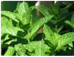
4 Marokkanische Minze